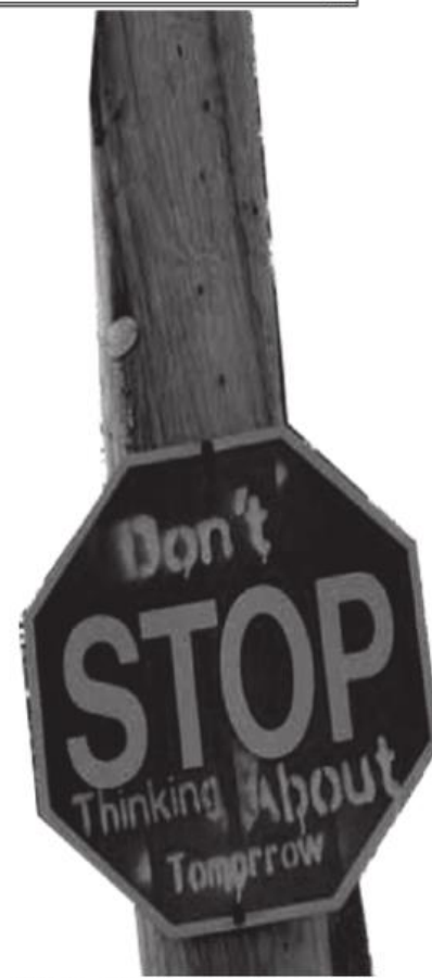
"Durma, gelecek hakkında düşün"

Son sorunsalın niteliğine, sorunun kökenlerinin ilginçliği açısından biraz daha değinmeli: Devrim kurguları her zaman varlığını olup olmadığının izahıyla işe başlama gereği duymuşlardır. Bugüne kadar onlar, istisnasız, -klasik anlamda insanın algısı çerçevesindeki maddi- varlığı bir aksiyonda, yani kendisinde kökenleştirmeyi en sağlam postula olarak koyageldiler. Oysa bugün anlaşılıyor ki, insanın varlık olarak nitelediği "maddi" oluşun kökeni, onun "yokluk", "boşluk" ya da "hiçlik" olarak