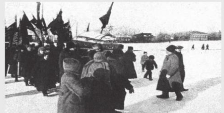
The funeral of Kropotkin, 13 February 1921.

28 Şubat 1921 Rusya: Bolşeviklere karşı Kronştad ayaklanması başladı.