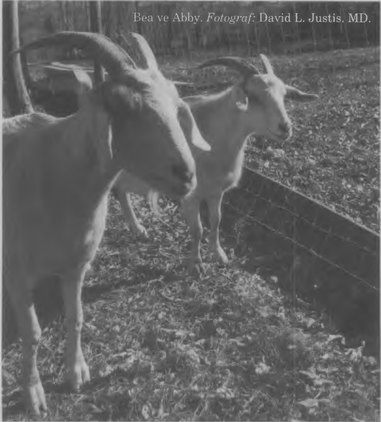
Bea ve Abby.

Bea'nin çok hoř, kirli beyaz bir rengi, bir tutam sakalı vardı ve çok sakindi. Kızı Abby ise aynı renkte ama sakalsızdı. Lynda ve Rich, önce Bea'yı almışlardı ve sadece altı hafta sonra Abby de etrafı çevrili bir alanda birlikte dolandıđı diđer keçilere katılmıştı. Bea ve Abby, bir süre sonra tekrar bir araya geldiklerinde ancak keçi neşesi olarak adlandırılacak şeyler yaptılar. Yüzlerini birbirlerine sürdüler, birbirlerini kucakladılar ve bu karşılıklı sevgi, Lynda'yı neredeyse ağlatıyordu.