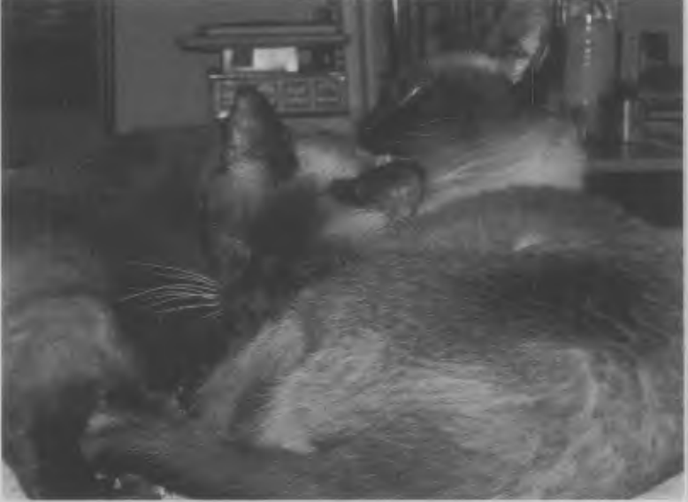
Willa ve Carson.

Ünlü yazarlar Willa Cather ve Carson McCullers'ın isimlerini alan bu iki kedi, Willa ve Carson, bu edebi eve bir 23 Nisan'da, Shakespeare'in doğum gününde, gelmişlerdi. Willa, grubun en tombuluydu. Carson, yarı fiyatına satılmıştı. Satıcı, "biraz çelimsiz" demişti.