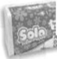
Solo Süper Becece 200ml