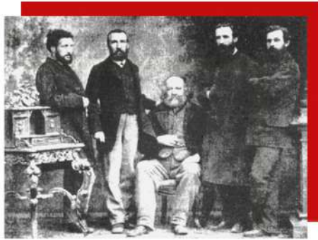
Sendikalizmin kökenleri - liberter sosyalistlerin 1869'da Basel'deki buluşması

Devrimci sendikalizmin kökleri anarşist harekete uzanmaktadır ve ünlü Rus anarşist Mikhail Bakunin'in " Geleceğin toplumsal örgütlenmesi, yalnızca aşağıdan yukarıya, işçilerin özgür birliği veya federasyonu tarafından, önce sendikalarda, sonra komünlerde, bölgelerde, uluslarda ve nihayet uluslararası ve evrensel büyük bir federasyonda yapılmalıdır. " dediği, Birinci Uluslararası İşçi Birliği'ndeki [1. Enternasyonel] liberter akıma kadar izi sürülebilir. IWW'nin 1905'teki ünlü " Tüzüğe önsöz "ünde Marx'tan alıntılıdığı " Bayrağımıza 'Adil bir iş günü için adil bir günlük ücret' şeklindeki muhafazakar slogan yerine, 'Ücret sisteminin kaldırılması' devrimci parolasını yazmalıyız. " sözünden anlaşılacağı üzere, endüstriyel sendikalizmin kökleri Marksist geleneğe dayanmaktadır.