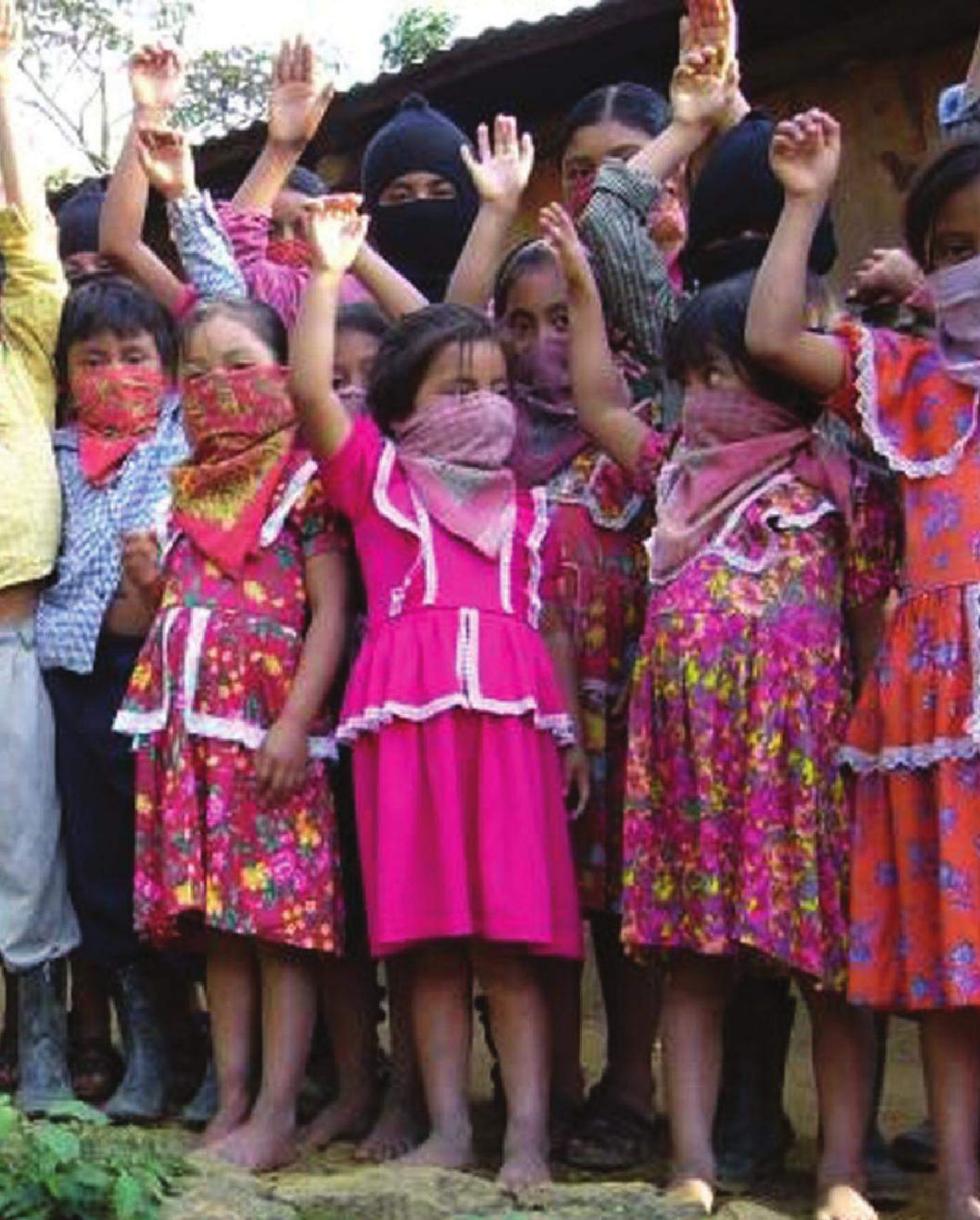
Bilginin paylaşma ve dayanışmayla özgürleştiği Chiapas'taki gençzapatistlerden bir sınıf fotoğrafı.