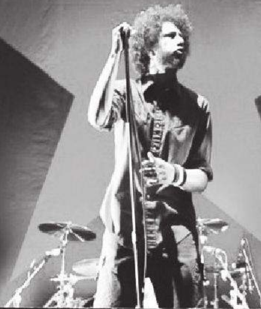
Zack de la Rocha