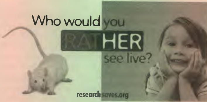
Görsel-1: ABD merkezli hayvan deneyi savunucusu Biyomedikal Araştırma Vakfı'nın ( Foundation for Biomedical Research ) Nisan 2011'de billboardlara astığı tartışma yaratan kampanya görseli.