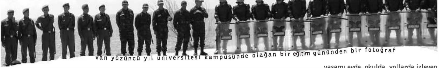
van yüzüncü yıl üniversitesi kampüsünde olağan bir eğitim gününden bir fotoğraf

Üniversitelerimiz gelişen çağa ayak uydurmakta gecikmiyor. Ege Üniversitesi'nde kayıtlar internet üzerinden yapılırken, Dokuz Eylül Üniversitesi'nde "tam otomasyona geçiş" müjdesi veriliyor. Oysa kayıt parasını vermeden açılmayan internet sayfasıyla kayıtların internet üzerinden yapılmasıyla beraber, iş kayıt parasını vermeyenlerle okul idaresini karşı karşıya getirmeden halledilmekte, Dokuz Eylül'de ise İş Bankası, güvenlik şirketleri, elektronik şirketleriyle bir iş ortaklığına girilmektedir. Hızla geçilen teknolojik sürecin hangisi öğrencilere yansıtılıyor? Kaç öğrenci dileğinde üniversitesinde bedava bilgisayar kullanıp, internete bağlanabiliyor? Kaç fakültede, kaç yurttaki bilimsel araştırma yapmak için gerekli donanım var. Bunların kaçına uygun. Kaç atölyemiz kaç laboratuvarımız var ve bunların içinde öğrencilerin kendi paralarıyla getirmediği kaç işlevsel üretkenliğe açık alet var? Diğer yandan üniversitede gezen belli silahlı "özel güvenlik görevlileri" olduğunu görüyoruz. Ve artık