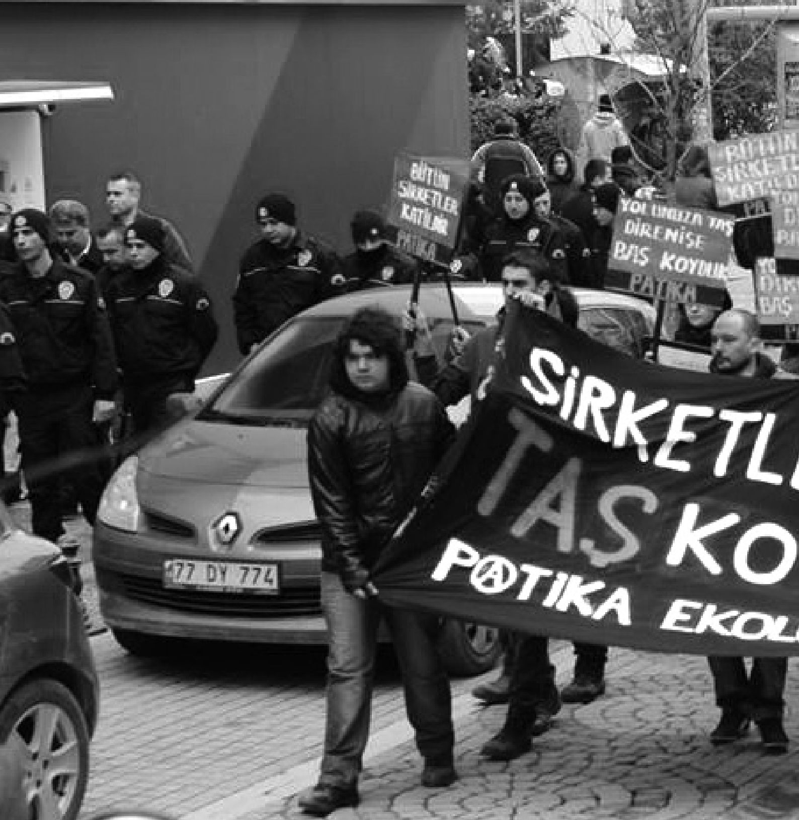
14 Şubat "Yalova'da Taş Ocağı İstemiyoruz" Mitingi