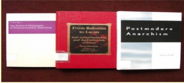
Postanarşizmler: Postyapısalcı mı postmodern mi?

'Anarşizm' için yapılan hayret verici sayıda tanımlı düşünülürken 'postanarşizmin' de ihtilafı bir terim olmasına şaşmamalı. Kelimenin ön eki olan 'post', hem 'post-yapısalcılığa' hem de 'postmodernizme' referans veriyor. Ayrıca, 'postmodernizm' de 'postanarşizm' de kendi başlarına tartışılmalı başlıklar; eleştirel kuramcı Jon Simons'un da ifade ettiği gibi düşünürleri bu tür net kategorilere ayırmak da kolay değil. Yine de, Terry Eagleton'un After Theory (Kuramdan Sonra) kitabında kullandığı postmodernizm tanımı 'postanarşizmin' çoklu anlamlarını çözümleyebilmek için iyi bir başlangıç noktası sayılabilir.