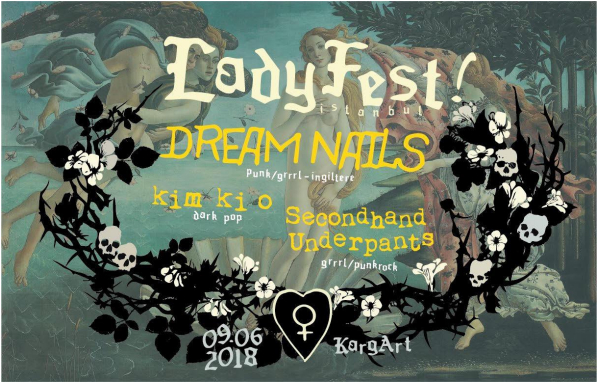
Ladyfest Istanbul '18 (Poster: İpek Celeste -Painite Prints-)