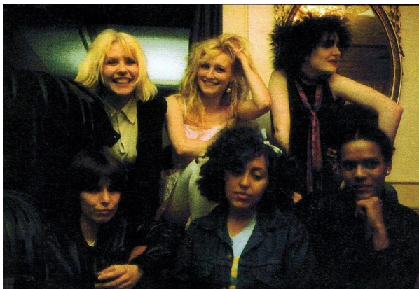
Ladies Tea Party – Debbie Harry (Blondie), Viv Albertine (The Slits), Siouxsie Sioux, Chrissie Hynde (The Pretenders), Poly Styrene (X-Ray Spex) Pauline Black (The Selector) (soldan saĝa) Londra, Aĝustos 1980