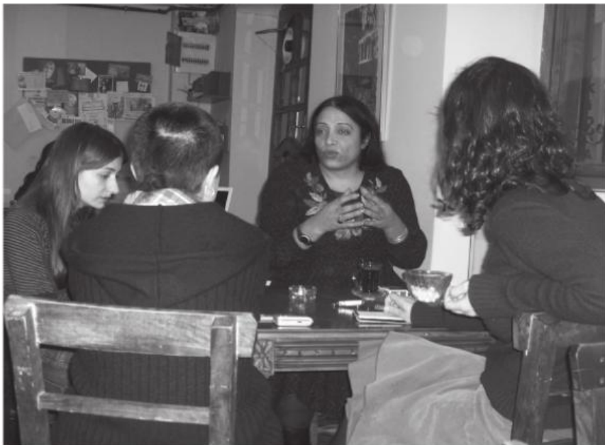
Cadının kazanını kaynattık... Esmeray'ın sohbetine doyamadık.