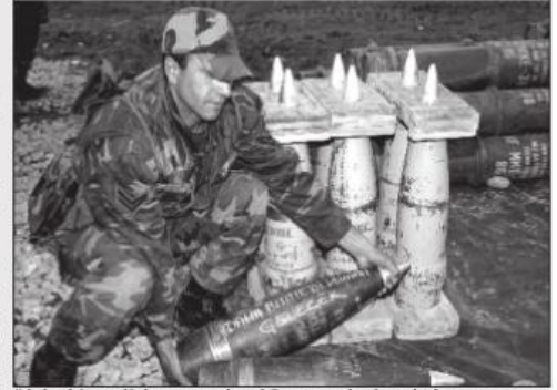
"daha bitmedi devamı gelecek" yazıyorlar bombalara...

Operasyona gelince daha önce de gördüğümüz 24 operasyondan farklı değil hiçbir şey. Üstelik